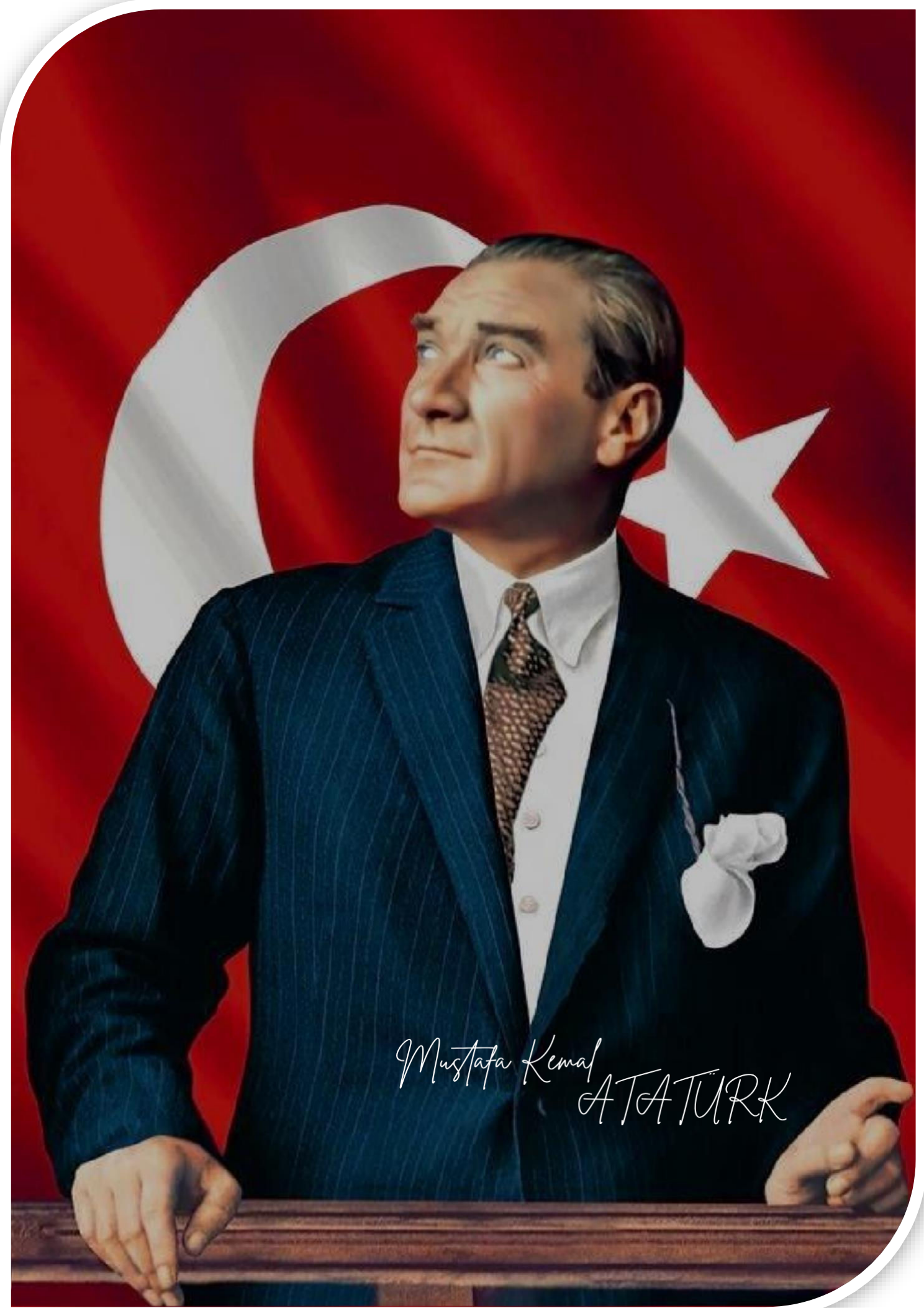
Mustafa Kemal ATATÜRK